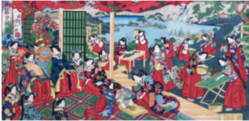
「養蚕皇国栄」梅堂国政筆 明治11年(扇子歴史情報研究所蔵)

皇室の御養蚕は、明治から大正、昭和と時代が経過する中で歴代の皇后に継承されている。平成の今も皇后様が毎年かつての養蚕農家が行っていたと同様の一連の作業行程を自ら手作業でなさっている。飼育されている蚕のうち小石丸は、その繊細な糸が古代裂の復元に不可欠なものであることが分かり、正倉院宝物の復元や、絵巻の名品、春日権現験記絵の修理などに役立てられ、文化財の復元という新たな役割を担っている。