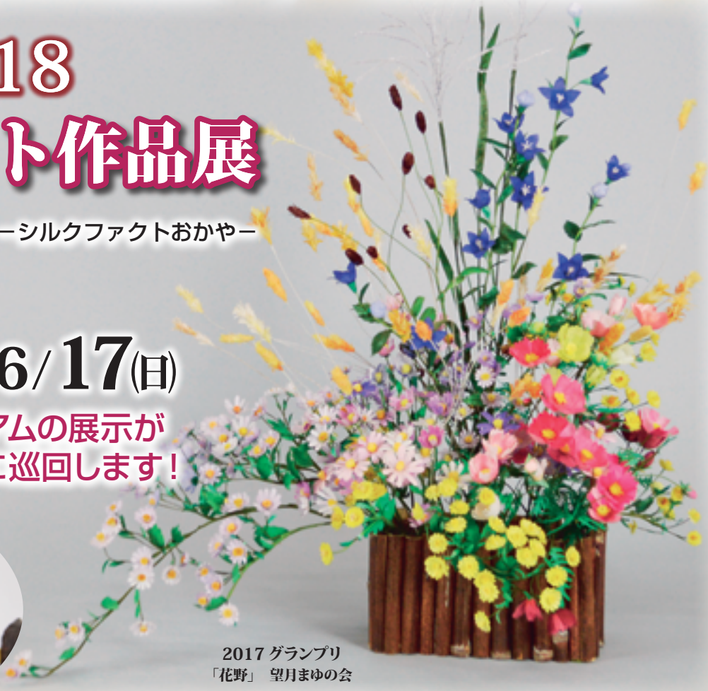
2017 グランプリ 「花野」 望月まゆの会